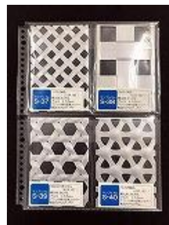
4枚（種）セット クリアファイルイメージ