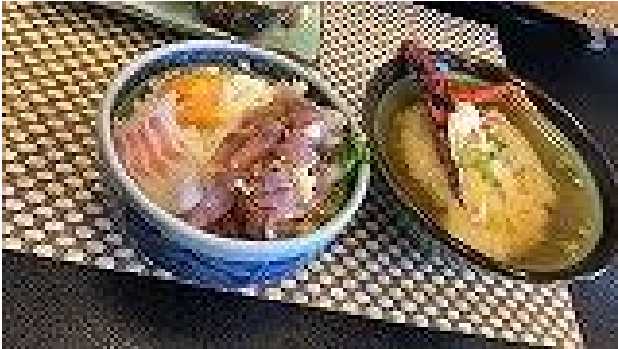
伊勢海老の頭を引き上げ、お味噌汁に