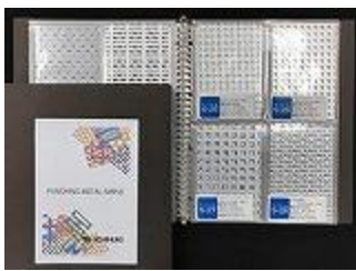
サンプル帳・バインダーイメージ