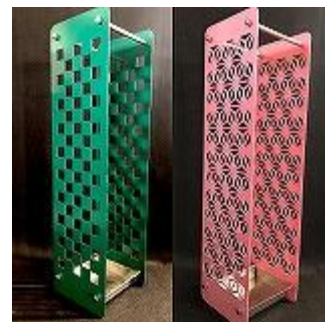
傘立て サイズ：160角×600 （只今検討中）