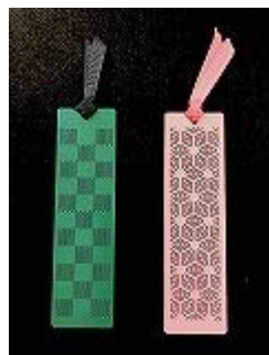
ブックマーク サイズ：40×145 販売価格：1枚 ¥ 495(税込み)