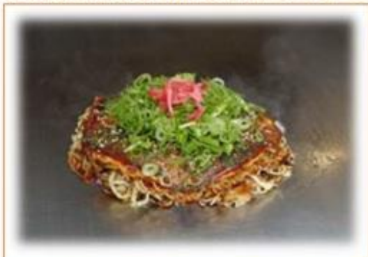
・お好み焼き(広島風・広島焼など)

・1996年に世界遺産指定、四度も保存工事をしています ・朝日新聞アンケートで日本一の饅頭を取ったことが!