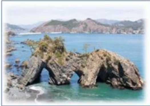
・穴通磯 (波の浸食で出来た磯)

私の出身地は、岩手県大船渡市というリアス式海岸で有名な漁業が盛んな町で青春時代を過ごしました。海産物、畜産物、農産物全ての食べ物が美味しく、漁師を営んでいた祖父の影響もあり海が大好きです。弊社工場が福島県にもあり、福島工場の方々と東北弁を話せて嬉しく思います。私の訛りは、浜人なので浜訛りで荒々しい訛りですが、そんな浜訛りが大好きです。私の原点である故郷をご紹介します。