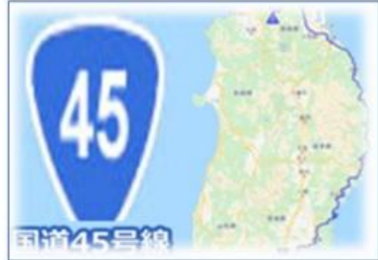
・国道45号線 (青森～仙台まで繋がっている海岸線の国道)