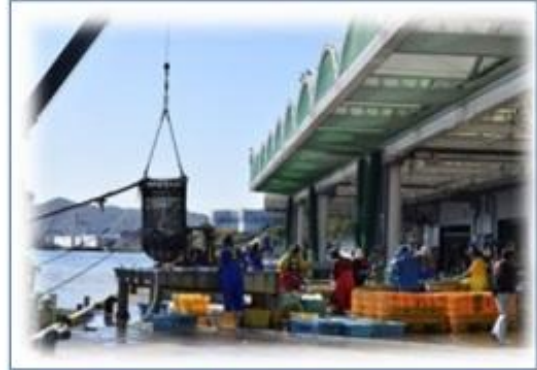
・大船渡魚市場 (昔の古い市場が大好きでした)