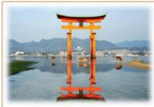
・厳島神社大鳥居(宮島)