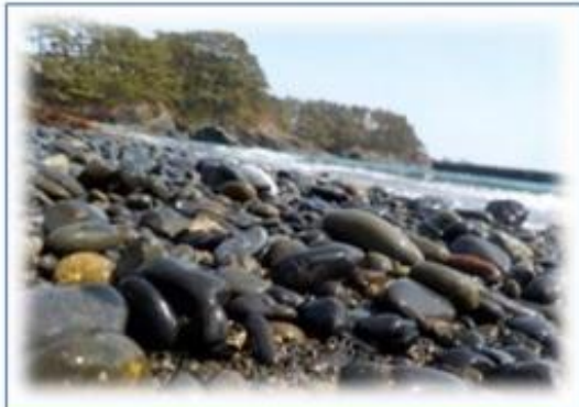
・基石海岸 (波の浸食で石が囲碁の石に似ている)