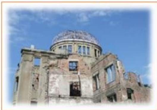
・原爆ドーム(元広島県産業奨励館)

私は1990年に広島県広島市で生まれ21歳まで広島で過ごしました。広島東洋カープが好きで広島市民球場に行くことが何よりの楽しみでした。そんな広島市民な私ではございますが、広島には二つ世界遺産があることも有名です。また、北は中国山地、南は瀬戸内海、市内には川が7本と自然に囲まれ気候も穏やかです。そんな私の地元、広島市をご紹介します。