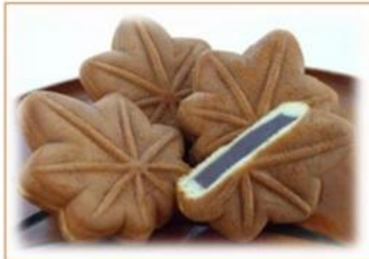
・もみじ饅頭(広島代表土産)

・1996年に世界遺産指定、四度も保存工事をしています ・朝日新聞アンケートで日本一の饅頭を取ったことが!