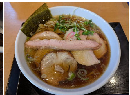
手打ち中華 餐：チャーシューメン