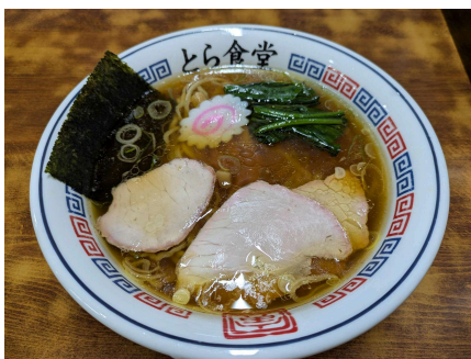
とら食堂：中華そば

また弊社へご来場の際にはご案内いたしますので、是非お気軽にお声がけください。 （富田）